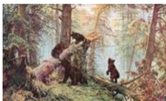
А) Мишки в лесу

6. Рассмотрите изображение, выберите верное название картины.